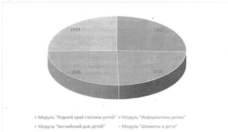
Рис. 1. Количество детей, принимающих участие в Модулях Программы

- в модуле «Шахматы и дети» участвуют 1933 (на 589 участников больше, чем в предыдущем периоде) ребёнка из 90 (59) групп (35 ОО).