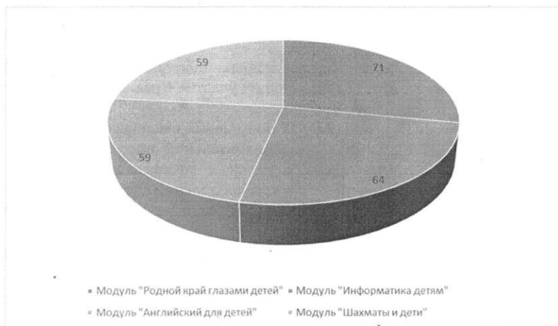
Рис. 2. Количество педагогов, реализующих дополнительную общеобразовательную программу по социально-коммуникативному и познавательному развитию «Современные дети»

Количество штатных единиц педагогов дополнительного образования, необходимых для реализации Программы, составило в этом году 30.